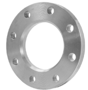
Type 02 Overschuifflens