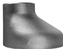
Excentrisch lasverloop EN