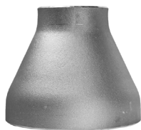
Concentrisch lasverloop EN