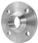
Type 11 Voorlasflens

■ De combinatie van voorraadspecialist en adviseur maakt Nijhuis & Wigger dé partner voor het leveren van een totaalpakket aan goederen en bijzondere producten.