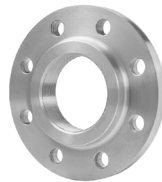
Type 13 Draadflens