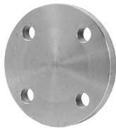
Type 05 Blindflens