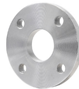
Type 01 Vlakke lasflens