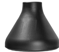
Concentric Reducer ASME