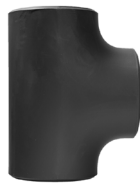
Equal Tee ASME