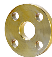
Lap Joint ASME