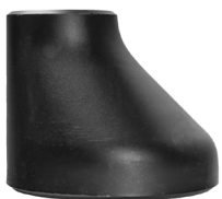
Eccentric Reducer ASME