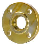
Socket Weld ASME