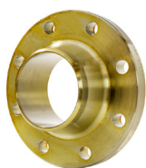
Welding Neck ASME

■ Dit komt tot uiting door duidelijke communicatie, persoonlijke maar zakelijke overwegingen en interesse, samen met u nadenken over oplossingen en alternatieven, een optimale toeleveringsketen en een positieve instelling.