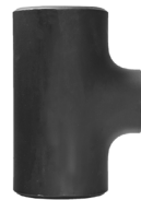
Reducing Tee ASME